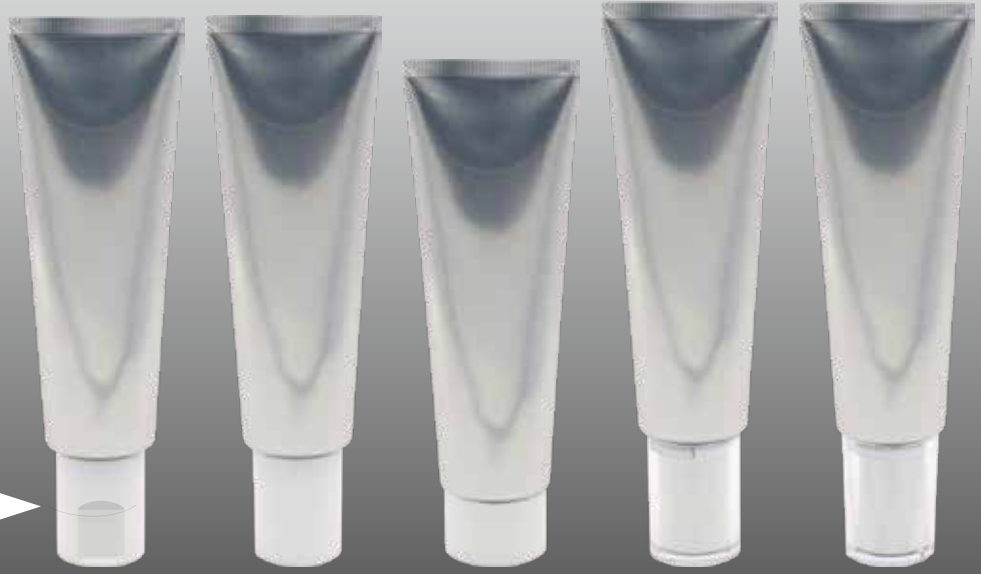
ワンタッチノズルCAP