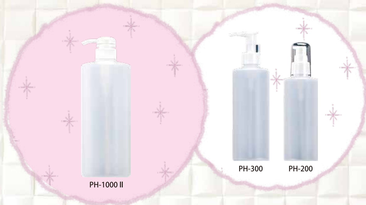
P用ワンタッチキャップ